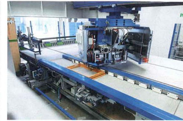
In der Endmontagehalle der Holz-Alu-Fenster kommt für das Befestigen der Klips-halterungen der Montageautomat der Serie KMA333 von Lemuth zum Einsatz.