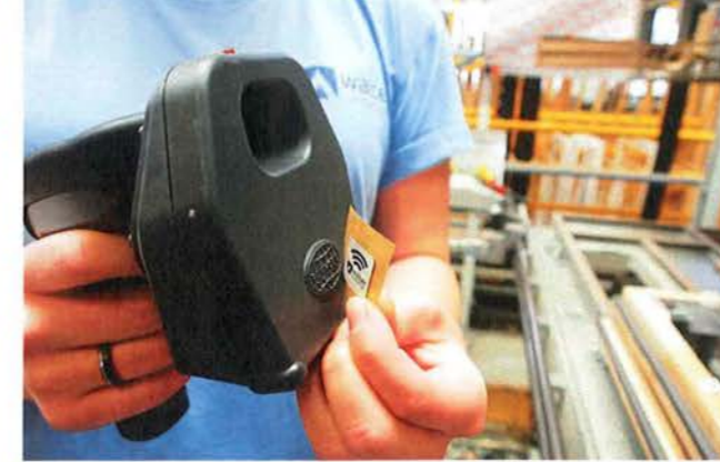
/ ... dann wird der NFC-Chip auf den Scanner gelegt und so mit den spezifischen Auftragsdaten des Fensters verknüpft.