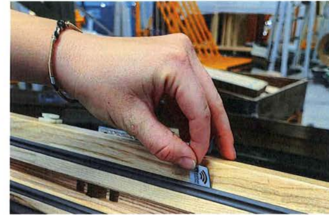
/ Zum Schluss positioniert die Mitarbeiterin den NFC-Chip an eine vordefinierte Stelle, immer oberhalb des Griffs.

Handy oder Tablet inklusive Zeiten und benötigtem Material. Er hat so jederzeit Zugriff auf Auftragsunterlagen wie Zeichnungen, Produktinformationen etc. Falls er auf der Baustelle bemerkt, dass etwas fehlt oder beschädigt ist, schickt er direkt über die App mit dem Smartphone eine Meldung an den Innendienst, der sich dann sofort um eine Lösung kümmern kann. Zum Schluss macht der Monteur mit dem Kunden über die App eine digitale Abnahme inklusive Fotos und erstellt eine Rückmeldung an den Innendienst. Dieser erhält dann eine Fertigmeldung im DBS-Cockpit und kann dann in der Klaes-Software zum Beispiel die Info zur Rechnungsstellung auslösen.