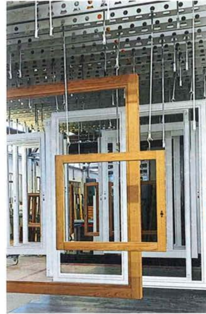
/ Bei den Holzfenstern wird der Chip im Flügelfalz aufgeklebt, da die Werkstoffdichte das Signal hemmt.