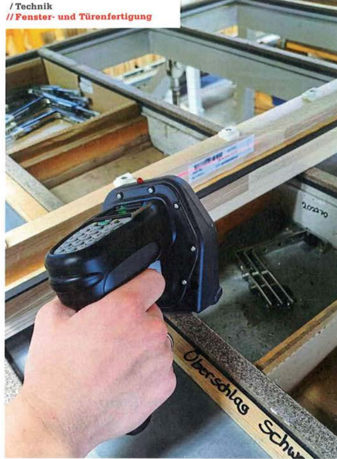
/ Damit das Fenster eindeutig identifizierbar ist, werden Fenster und NFC-Chip „verheiratet“. Zuerst scannt die Mitarbeiterin den Barcode des Fensters ...

/ Technik // Fenster- und Türenfertigung