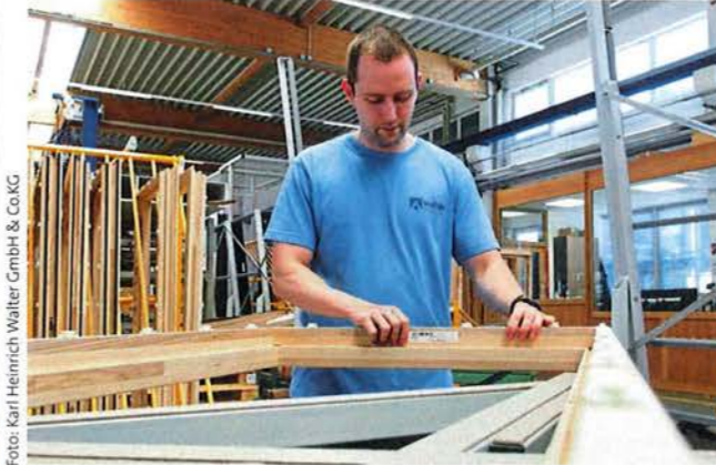
Danach setzt der Mitarbeiter sämtliche Dichtungen ein, bevor die Fenster gechipt und verglast werden.